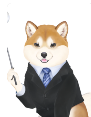
柴犬老師陪你寫漢字！

請描寫漢字：先看左邊大字、意思、音讀（カタカナ）／訓讀（ひらがな）、畫數與部首，再沿著淡色字描 3 格，記住形狀後在空白格自己寫 7 次。一邊唸熟語一邊寫，連讀音一起記。