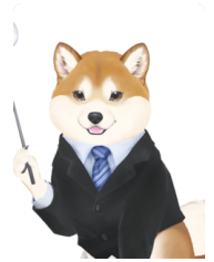
柴犬老師陪你寫漢字！

請描寫漢字：先看左邊大字、意思、音讀（カタカナ）／訓讀（ひらがな）、畫數與部首，再沿著淡色字描 3 格，記住形狀後在空白格自己寫 7 次。一邊唸熟語一邊寫，連讀音一起記。